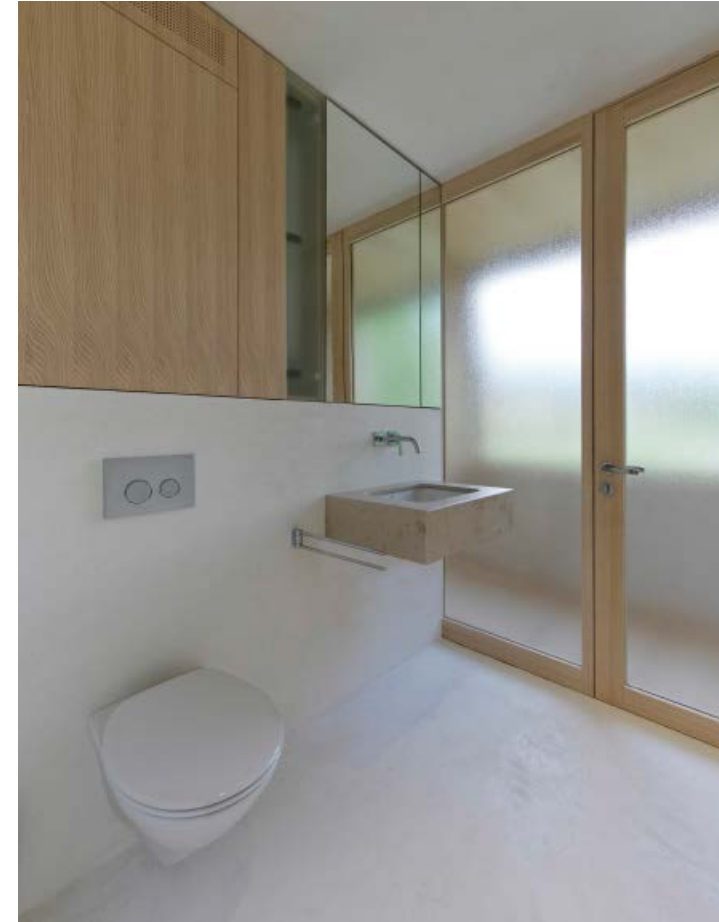
HAUS GH, ESCHEN Cukrowicz Nachbaur Architekten