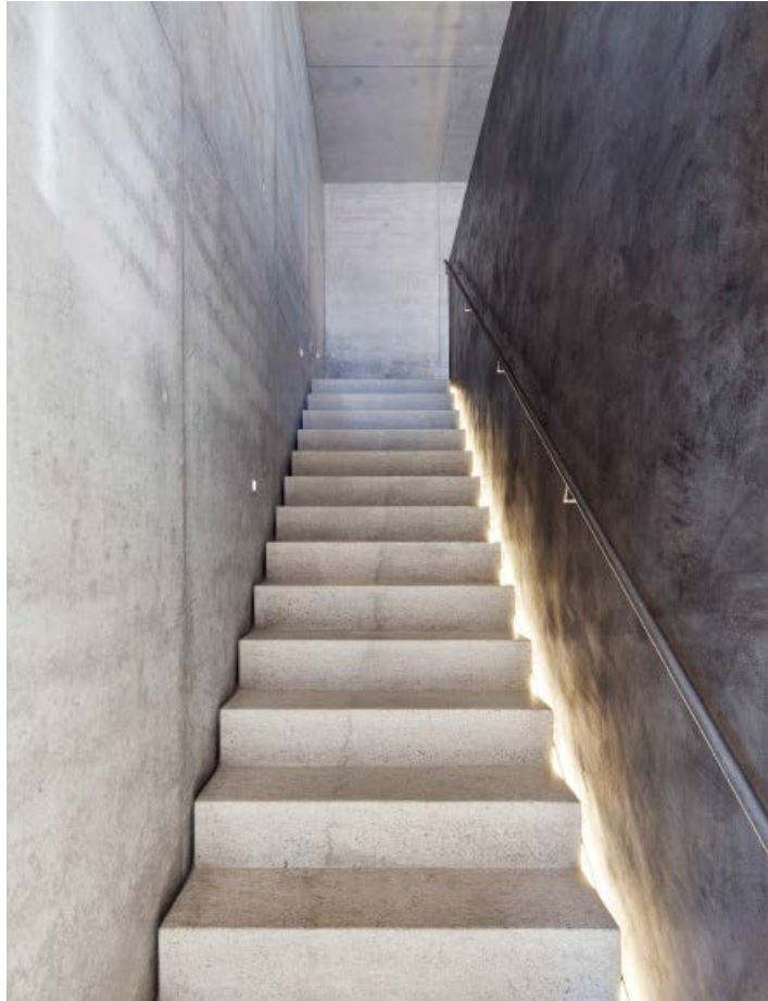
HAUS S, BREGENZ Dietrich | Untertrifaller Architekten