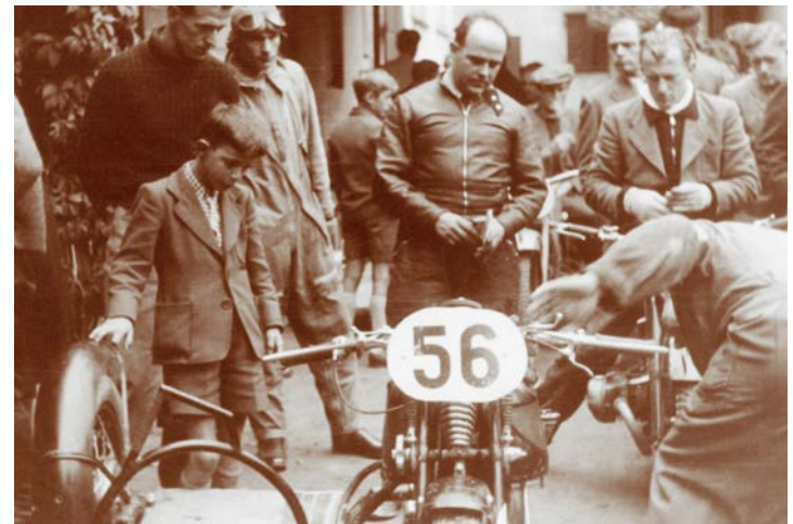
Bei der Fahrzeug-Abnahme zum Bürserberg-Rennen, 1946