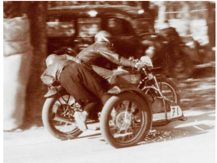
Erste Rennen mit Gernot Zingerle: Ries-Bergrennen, Schlossberg-Rennen (beide 1946)