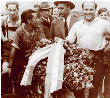
Vor dem Start in Salzburg ... und nach dem Rennen, 1947