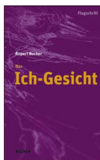
Das Ich-Gesicht ISBN 978-3-99018-442-4