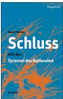
Schluss mit der Tyrannei des Rationalen ISBN 978-3-99018-364-9