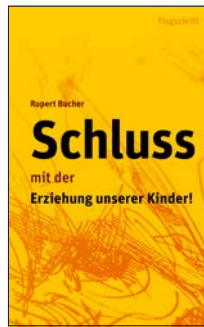
Schluss mit der Erziehung unserer Kinder! ISBN 978-3-99018-339-7