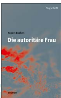
Die autoritäre Frau ISBN 978-3-99018-404-2