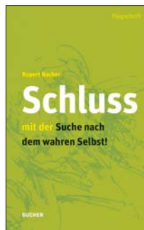
Schluss mit der Suche nach dem wahren Selbst! ISBN 978-3-99018-403-5