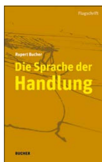
Die Sprache der Handlung ISBN 978-3-99018-441-7