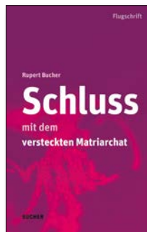
Schluss mit dem versteckten Matriarchat ISBN 978-3-99018-365-6